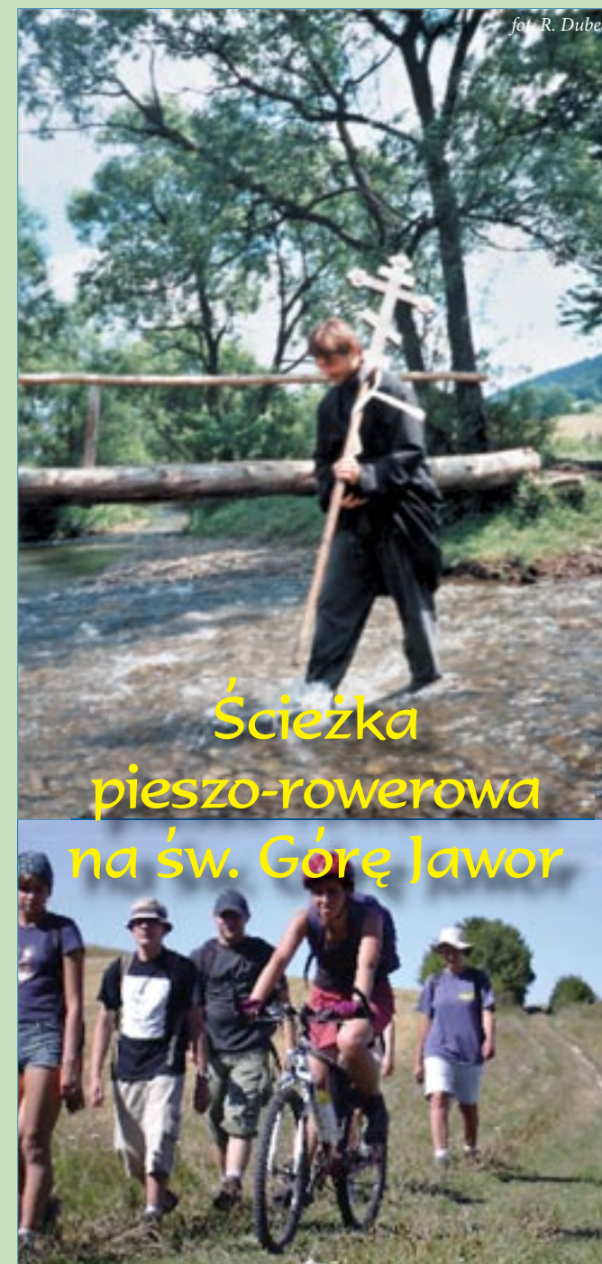
fot. R. Dubec

Dojście do kaplicy od cerkwi w Wysowej – początkowo szlakiem zielonym. Po przekroczeniu Ropy, po około 300 m. zejście ze szlaku w lewo - na południe poprzez łąki i wzdłuż zadrzewionego jaru, wyraźna ścieżka do kaplicy. Po drodze piękna panorama południowej części Wysowej i Blechnarki. Trasa ścieżki ok. 3 km. Czas przejścia ok. 1-1,5 godz. Przejazd rowerem ok. 30 min.